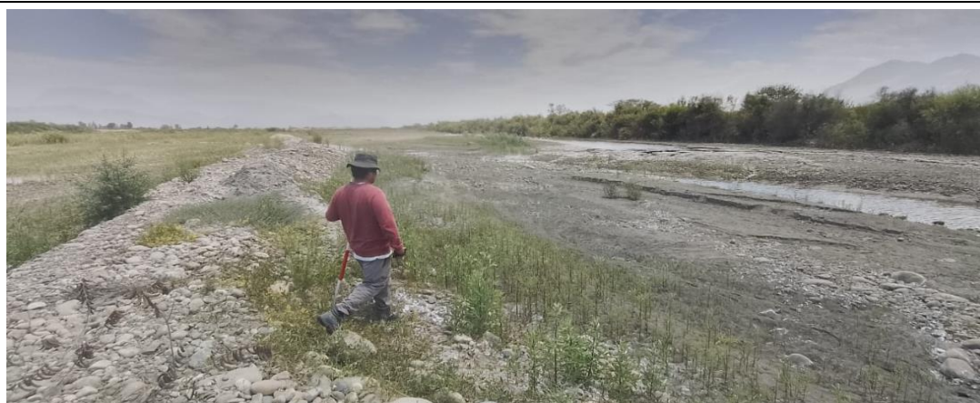
CAUCE DEL RIO CHICAMA COLMATADO