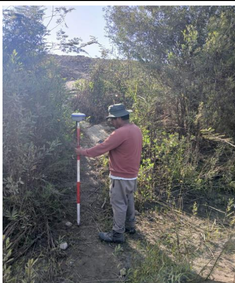
FOTOS DE CAUCE DE RIO CHICAMA COLMATADO